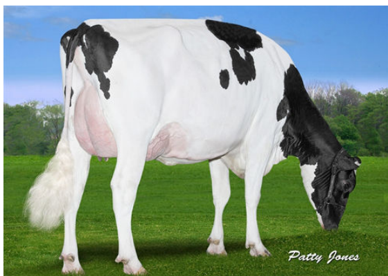
CLAYNOOK FABBY SILVER GRANDDAM