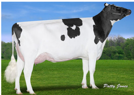
CLAYNOOK FABBY SILVER GRANDDAM